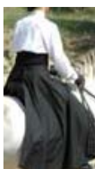
12 points Tenue partielle