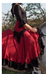
10 points Tenue « folkloriques »